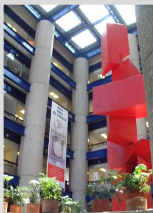
Instituto Nacional de Salud Pública en Cuernavaca, Morelos, sede del XXV Foro