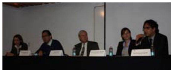
Seminarios Institucionales organizados por las Líneas de Investigación en Evaluación (arriba) y VIH/SIDA (abajo).