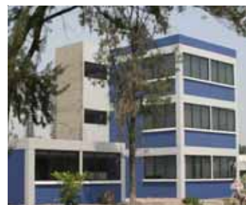
El nuevo edificio