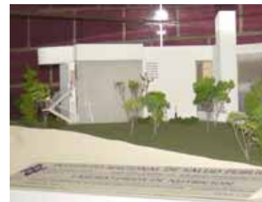
Maqueta del proyecto del laboratorio de nutrición. La puedes ver en las oficinas de la Dirección General