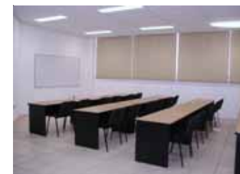
Interior de aulas