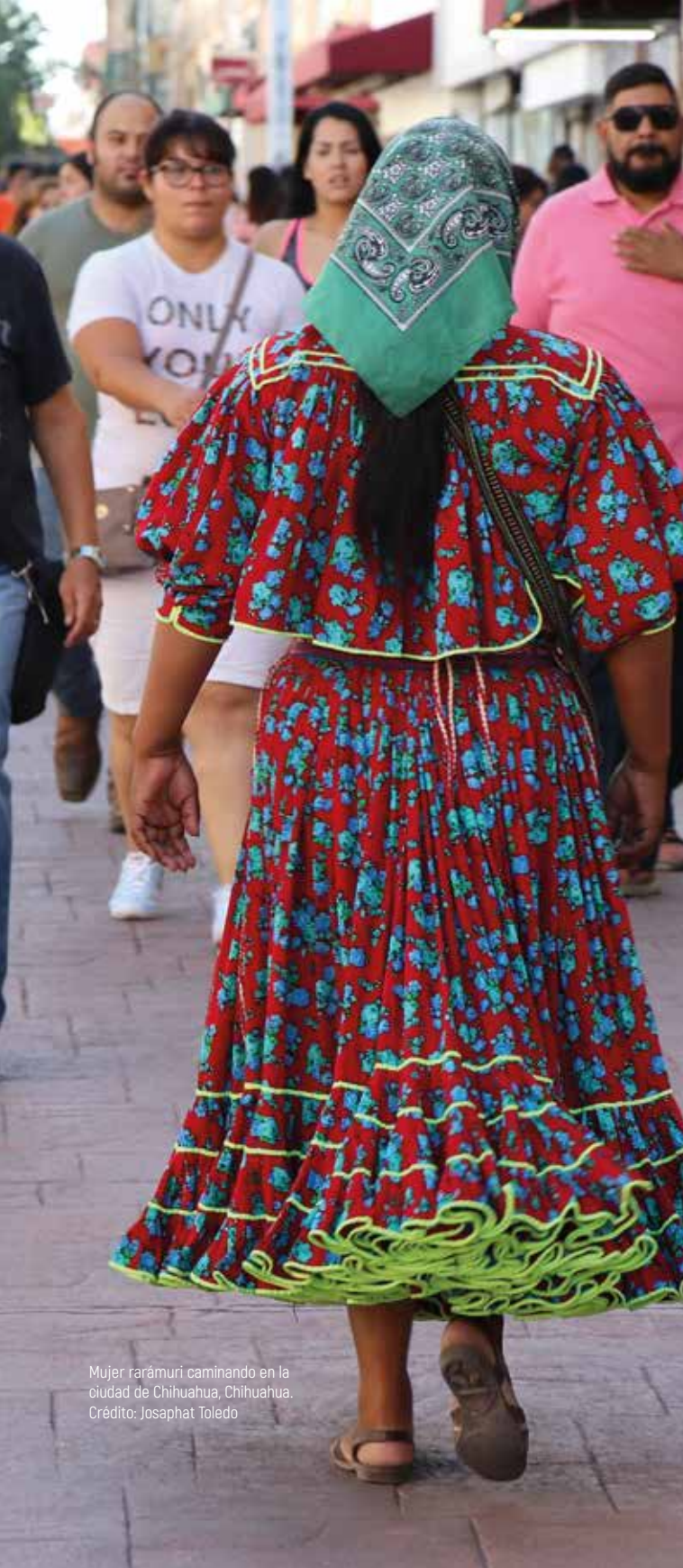
Mujer rarámuri caminando en la ciudad de Chihuahua, Chihuahua.